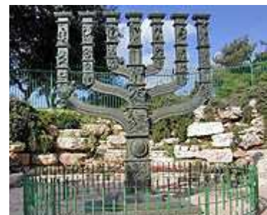
Mémorah à Jérusalem

En Mai 1948, survint un évènement auquel personne n'aurait voulu croire au début du siècle: la proclamation de l'Etat d'Israël.